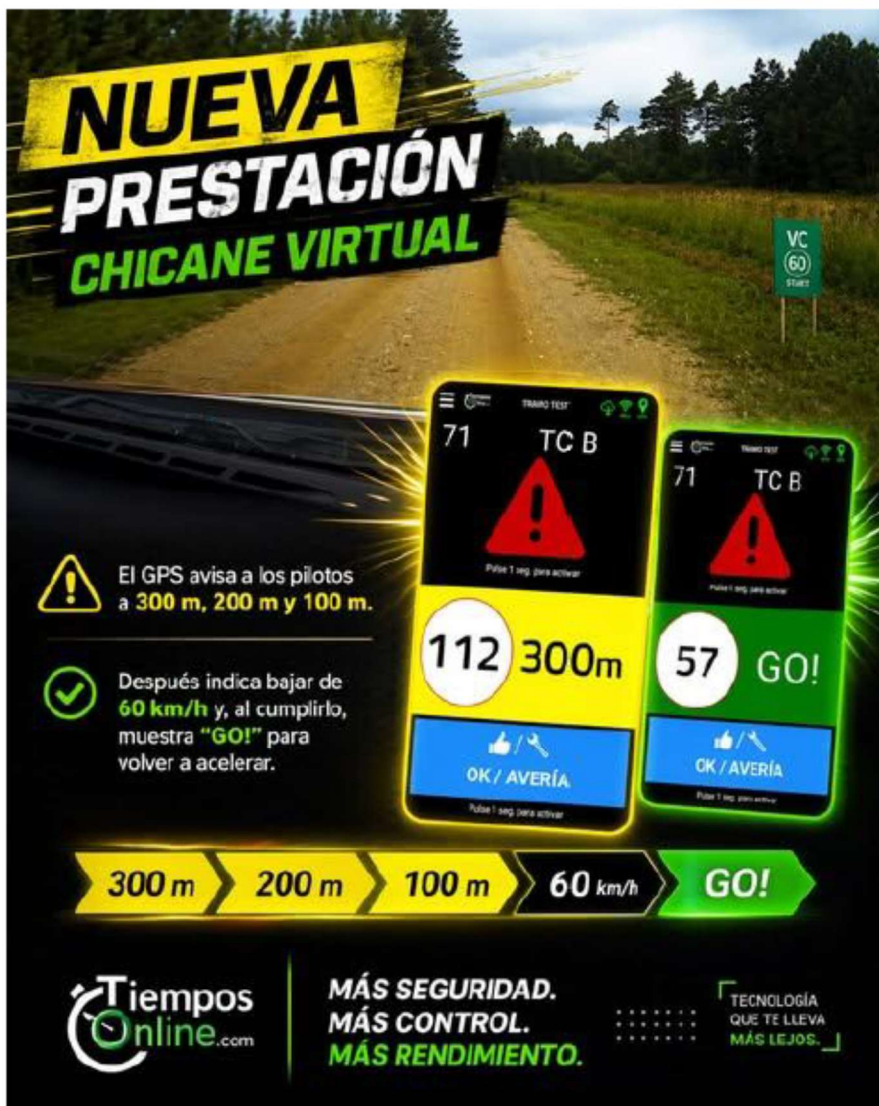
Pantallas del GPS de Seguridad:

El Organizador también tendrá a su disposición las chicaneas virtuales. El Organizador deberá marcar claramente la zona de inicio y final, y vendrá claramente indicado en el road-book y manual de seguridad. Durante estas dos señales, el vehículo deberá frenar hasta que su velocidad sea inferior a 60 km/h. Una vez alcanzada esa velocidad, podrá continuar en orden de marcha normal. El dispositivo GPS indicará que se ha alcanzado la velocidad indicada.